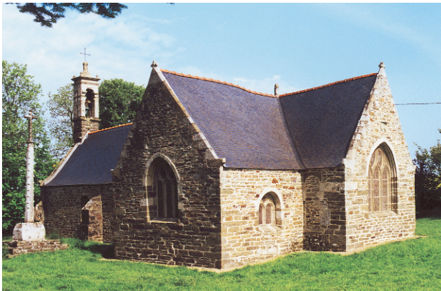
CHAPELLE DE LA TRINITÉ

E Avant de s'engager à gauche dans la sapinière, il est conseillé de continuer sur 500 m pour admirer le Moulin de Penaud (propriété privée) et ses dépendances parfaitement restaurés, ainsi que son environnement. S'engager dans un passage, puis, remonter le bois en suivant le talus jusqu'au chemin herbeux. Tourner à gauche jusqu'à la route goudronnée. Remonter à droite vers la Chapelle de la Trinité.